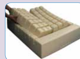
Retrait de deux modules.