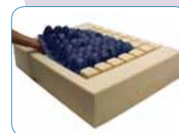
Installation de l'insert.