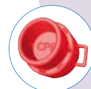
Nouvelle vanne CPR (Cardio Pulmonary Rescue)